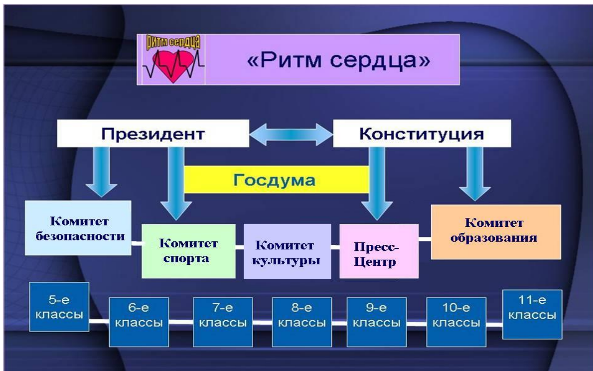
Рис. 1. Структура ШДО «Ритм сердца».

Самоуправление в школе находится в состоянии непрерывного развития, которое связано с изменениями, происходящими в обществе в целом и в школе. В школе сложилась определенная структура управления ШДО.